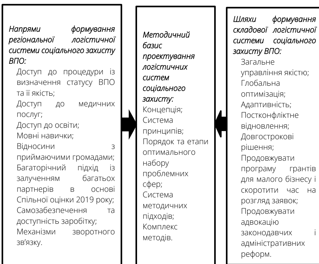
Рис. 2. Методичний базис проектування логістичних систем соціального захисту ВПО

Сформовано теоретичний підхід до трактування соціальної системи захисту ВПО, але ж диференціальна варіативність у рівнях соціально-економічного розвитку зумовлює міжрегіональну диференціацію, відповідно до цієї проблематики створюється методичний базис охоплення комплексу проектування логістичних систем соціального захисту ВПО (рис. 2).