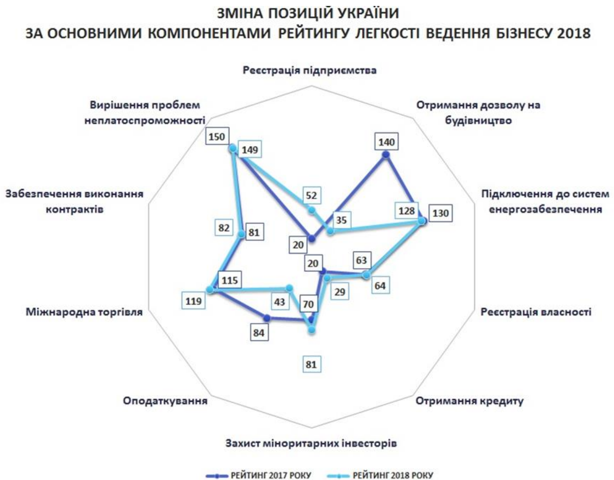
Рис. 2 Позиція України в рейтингу легкості ведення бізнесу

2% та зниженню вартості послуг з технагляду; + 41 пункт по "сплаті податків" за зменшення та уніфікацію ставки ЄСВ. Також, слід відзначити, що у рейтингу агентства Moody's Investors Service Україна покращила свій кредитний рейтинг в міжнародному економічному списку. Він змінився з Саа3 до Саа2, що означає зміна прогнозу зі "стабільного" на "позитивний". Так, на поліпшення показників вплинуло проведення структурних реформ в Україні, що допомогло країні впоратися з борговим навантаженням і поліпшити позиції на зовнішніх ринках. Крім того, у рейтингу Глобального індексу конкурентоспроможності (ГІК) 2017/2018 Україна покращила свої позиції на 4 пункти і зайняла 81 місце серед 137 країн світу, які досліджувались (у ГІК 2016/2017 – 85 місце серед 138 країн). [1-7]