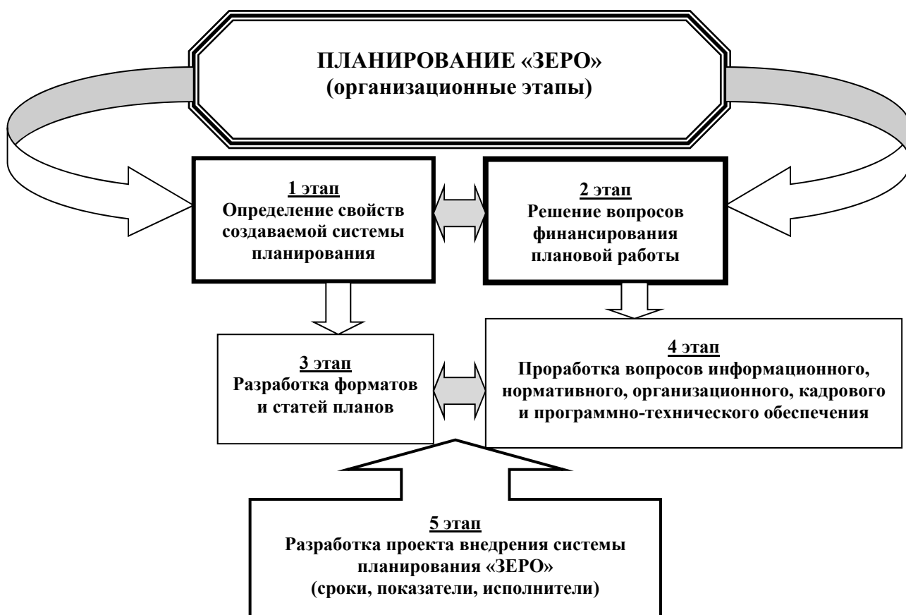
Рис. 1. Организационная схема этапов внутрифирменного планирования способом «ЗЕРО» (с нуля)

Совершенствование качества планирования тесно связано с решением комплекса методологических вопросов, определяющих выбор правильной схемы внутрифирменного планирования, развитие нормативной базы, повышение точности соизмерения затрат и результатов производственной деятельности. Использование информационных ресурсов, программного обеспечения, функционирующая система повышения квалификации работников планово-экономических служб также способствуют повышению качества планирования организации [7].