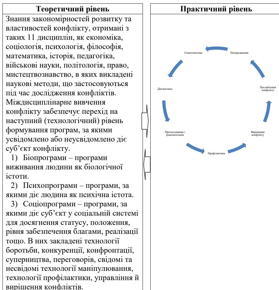
Рис. 3. Взаємозв'язок теоретичного та практичного рівнів діагностики конфліктів під час вирішення питання їх трансформації

Соціально-позитивний конфлікт є можливим тоді, коли конфліктуючі сторони усвідомлюють відповідальність за його наслідки. Це стає конструктивом і сприяє вирішенню проблем і протиріч, а також переходу людини, організації, суспільства, держави на новий рівень розвитку. Такий перехід на новий рівень відносин є можливим за досягнення феномена цілісності, що стає соціальним феноменом. Щодо функціональної взаємодії елементів у цілісності, то її можна відслідкувати з використанням діагностики конфлікту, що нерозривно пов'язана з аналізом та синтезом. Введення цього поняття ставить перед дослідниками завдання виокремлення цілісності конфлікту та методів його дослідження. Ця цілісність не може належати жодній науковій дисципліні, що займається дослідженням конфліктів. Більш того, з огляду на певну практичну задачу на перший план можуть виходити функції або характеристики, які за іншої постановки завдання не мали істотного значення.