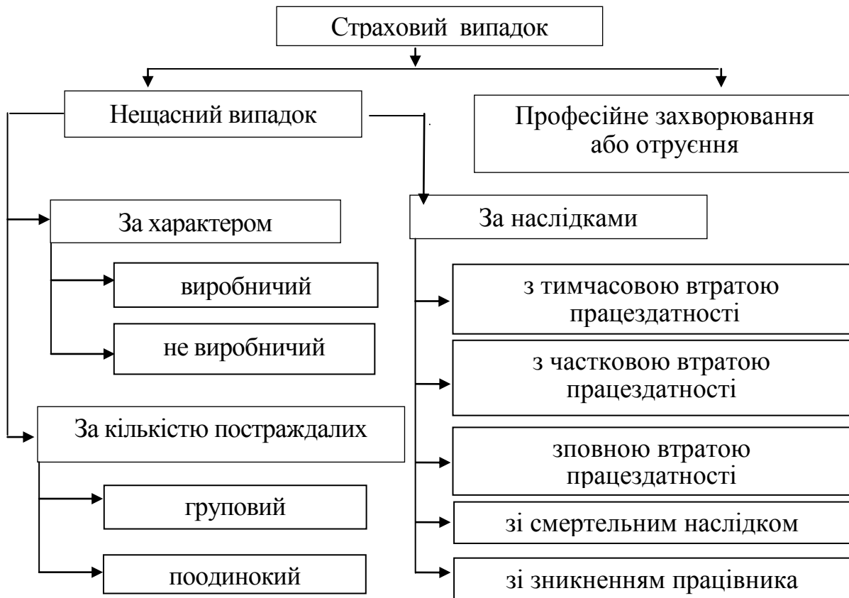
Рисунок 6.1 – Класифікація страхових випадків

Відповідно до Закону про соціальне страхування при настанні страхового випадку потерпілому відшкодовуються збитки у вигляді страхових виплат. Усі види страхових виплат і соціальних послуг здійснюються Фондом соціального страхування.