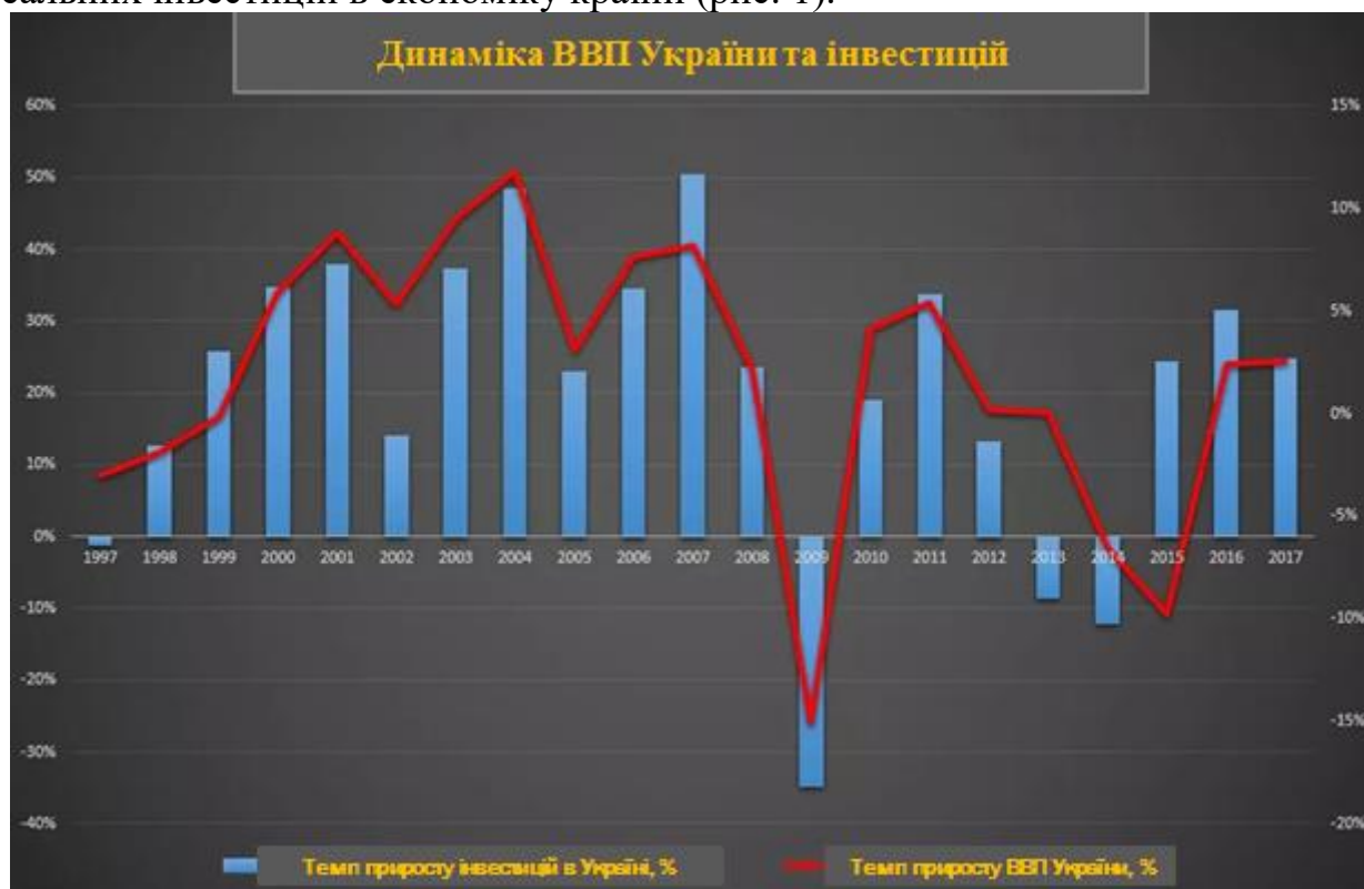
Рис. 1. Динаміка ВВП України та інвестицій Джерело: [11]

Після економічної кризи у 2008-2009 р.р. і політичних криз зі зміною влади у 2004-2005 р.р. і 2014-2015 р.р. спостерігалось зниження притоків реальних інвестицій в економіку країни (рис. 1).