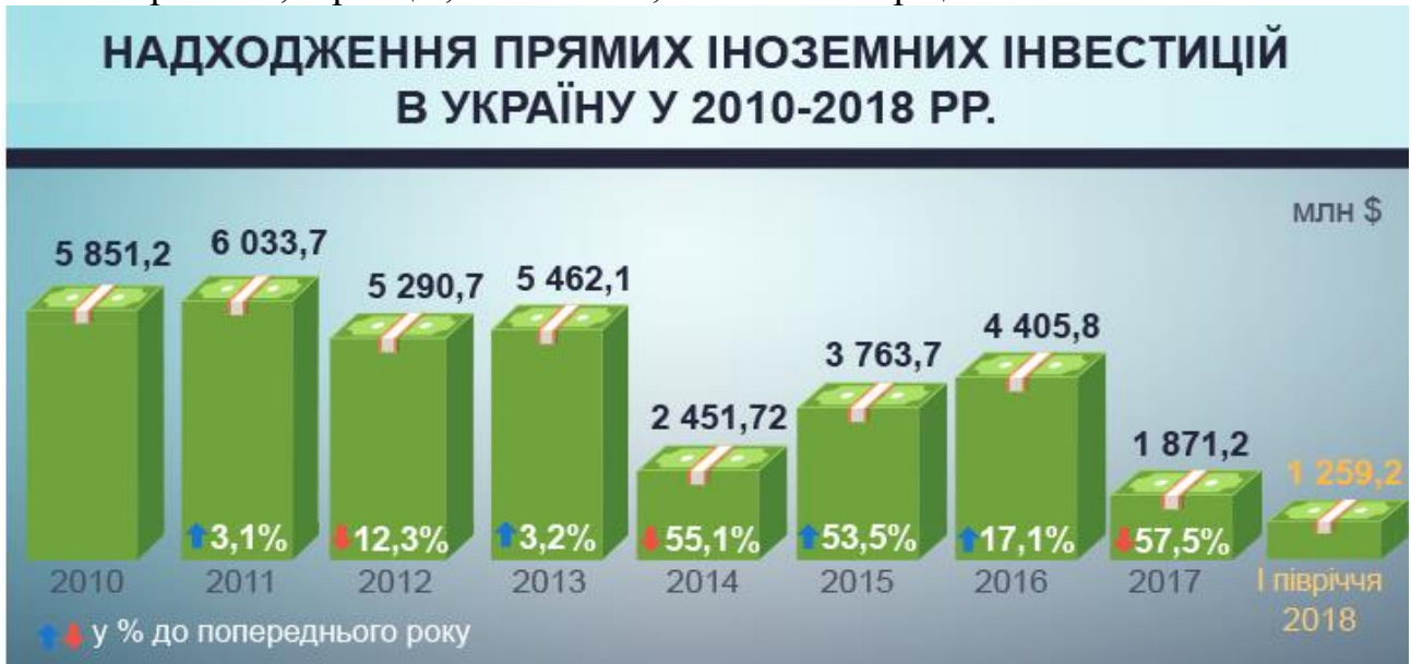
Рис. 2. Надходження прямих іноземних інвестицій в Україну у 2010-2018 рр. Джерело: [4]

Аналіз найбільших надходжень країн - інвесторів (рис. 3) дозволяє констатувати, що Росія, як це не здається дивним, вклала в економіку України більше всього коштів, в 2018 році її інвестиції склали 34,6% від усього обсягу, що частково пов'язано з докапіталізацією банків. Вкладають кошти в економіку України останні роки такі країни: Кіпр, Нідерланди, Австрія, Польща, Великобританія, Франція, Німеччина, Італія та Угорщина.