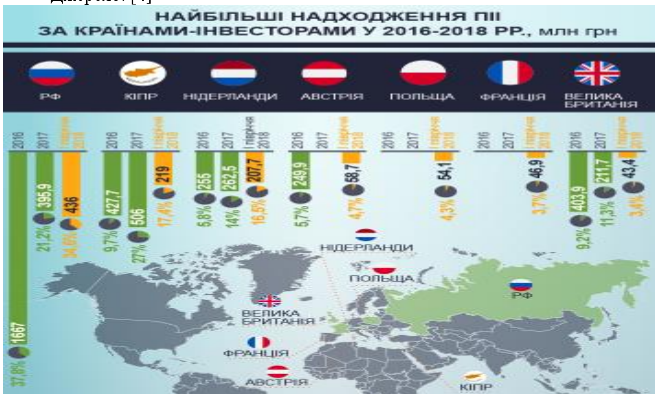
Рис. 3. Найбільші надходження країн-інвесторів Джерело: [4]